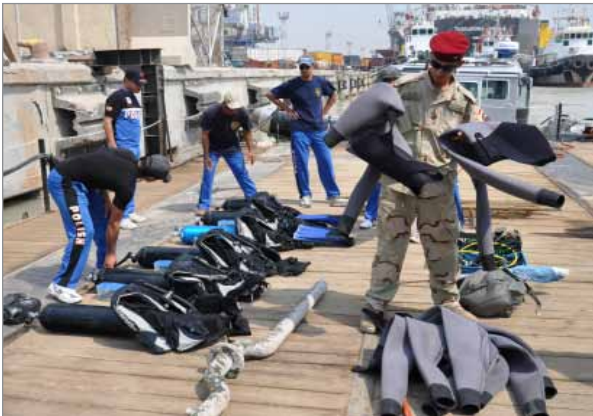
Participating in a curriculum of professional instruction provided by the Iraqi Training and Advisory Mission Navy Umm Qasr, Iraqi Navy diving students lay out their diving suits and rigs in preparation for training under the administration of expert U.S. Navy divers from Mobile Diving and Salvage Unit 1.