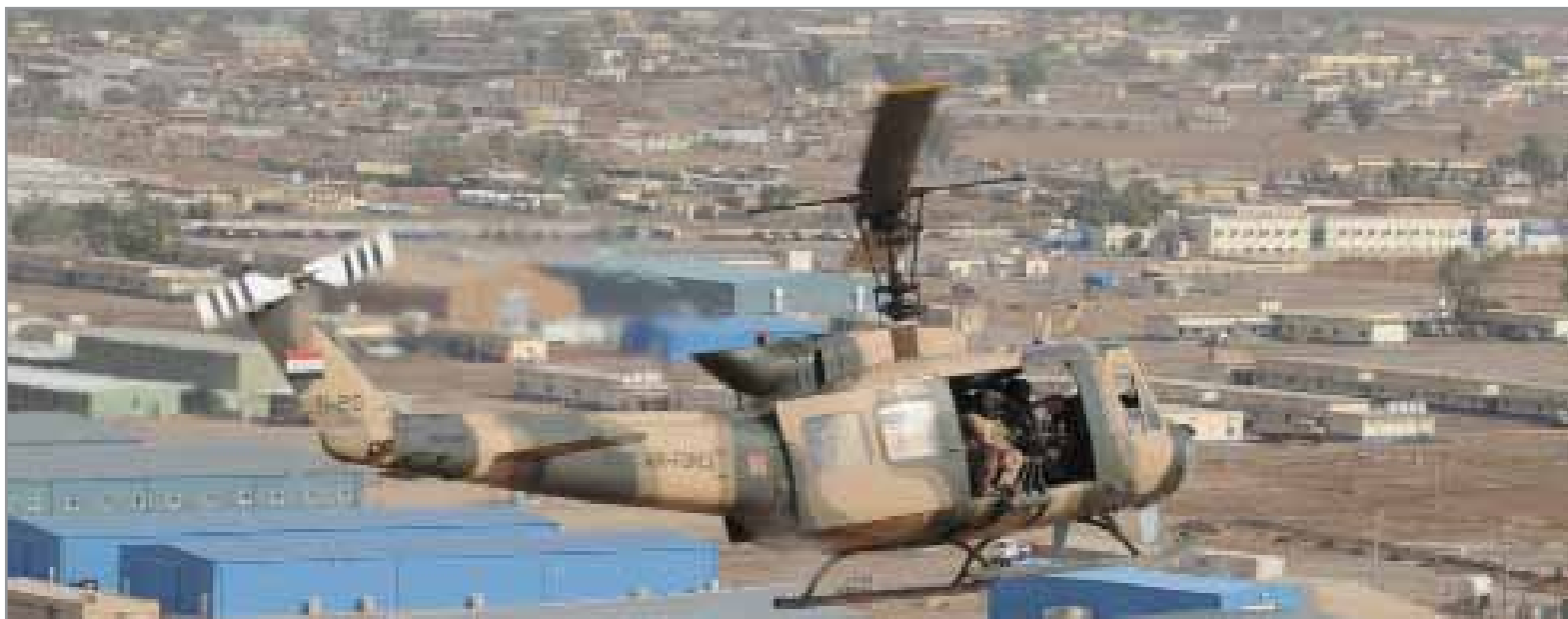
Air Force instructors fly on a training mission with their Iraqi students as the Iraqi pilots perform aerial formation flying procedures. The U.S. Airmen train, advise and assist Iraqi helicopter pilots around the clock, helping the Iraqis develop their air force.