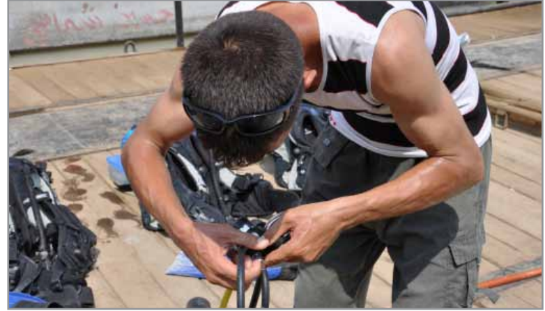
احد طلاب غوص البحرية العراقية يتفقد منظم الغوص الخاص به كجزء من عملية تدقيق السلامة الإلزامية.

تسعى الآن المجموعة الثالثة من طلاب الغطس في البحرية العراقية لنيل شهادة التدريب على الغطس من بعثة الاستشارة والتدريب- البحرية، حيث ستدخل المرحلة الثالثة والأخيرة من التدريب في أم قصر في العراق. إن الهدف من برنامج التدريب على الغطس هو ضمان وجود وحدات غطس من موظفي البحرية العراقية المؤهلين وذلك بحلول نهاية عام ٢٠١١ عندما تغادر القوات الاميركية العراق. وتتضمن مجموعة المتدربين على