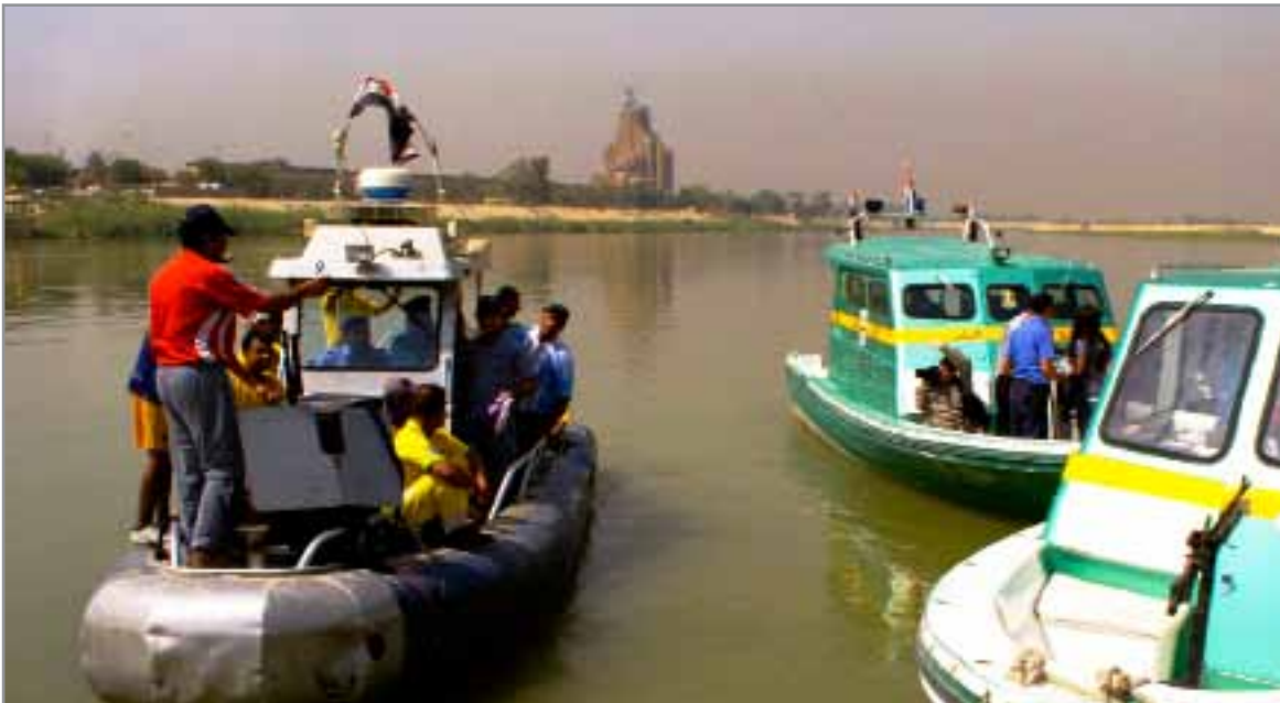
الشرطة النهرية العراقية تطلق زوارق دورية في نهر دجلة في بغداد في أواخر آب.

احد طلاب الجيش العراقي من مدرسة إبطال مفعول القنابل يمرر حبل من خلال بكرة خلال ممارسة في مركز التدريب القتالي في بسمالية في وقت سابق من هذا العام. مدرسة إبطال مفعول القنابل تدرب الطلاب من الجيش العراقي والشرطة.