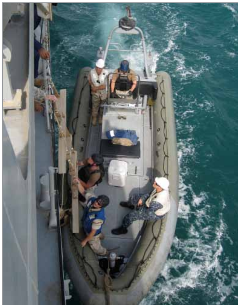
A U.S. Navy Vessel Board Search and Seizure team aboard a Rigid Hull Inflatable Boat pulls alongside the Iraqi Navy Patrol Boat Nasir (IQN 701) Aug. 4, off Umm Qasr, Iraq, during a series of at-sea evolutions conducted by the Iraq Training and Advisory Mission-Navy.

"It gives our people a chance to interact with the Iraqis," Lone said. "It builds a relationship, and it opens the possibility of future maritime operations together."