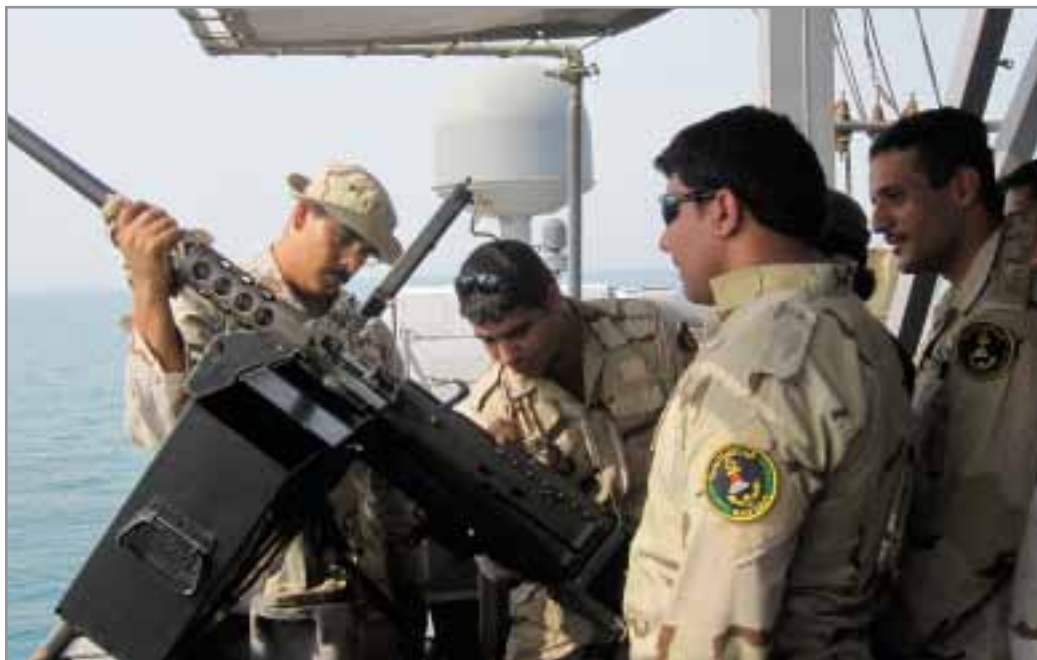
Iraqi navy personnel learn the fundamentals of using the M2.50 caliber machine gun from a Coalition Naval Advisory Training Team member off the port of Umm Qasr.