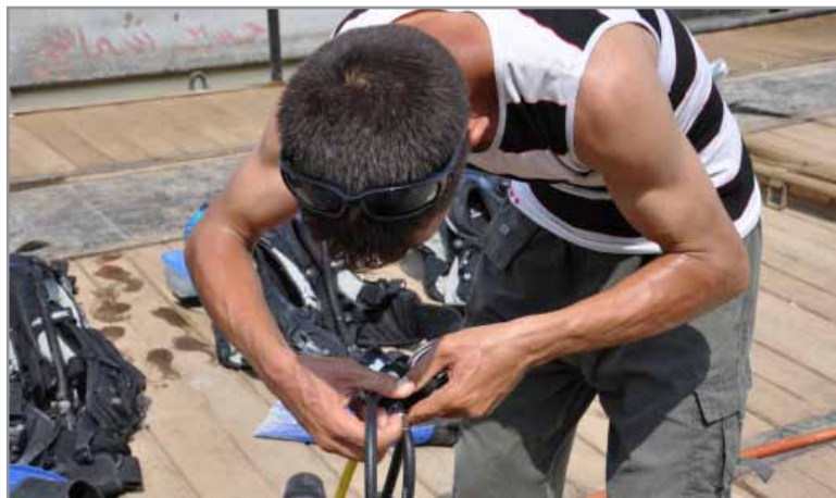
An Iraqi Navy diving student inspects his diving regulator as part of a mandatory safety check.

At the end of the month, the formal diver certification training for this group of divers will end. The newly certified Iraqi divers will then move on to their respective postings within the Iraqi Navy. The ITAM-Navy diver certification program at Umm Qasr is scheduled to continue to train and develop Iraqi Navy divers until the end of 2011.