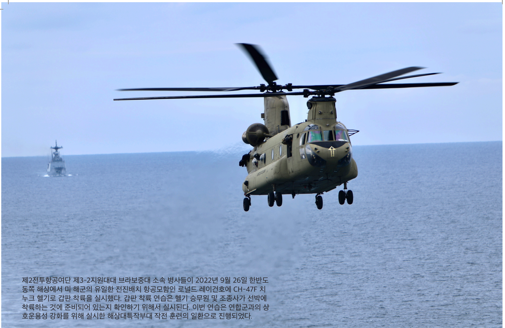
제2전투항공여단 제3-2지원대대 브라보중대 소속 병사들이 2022년 9월 26일 한반도 동쪽 해상에서 미 해군의 유일한 전진배치 항공모함인 로널드 레이건호에 CH-47F 치누크 헬기로 갑판 착륙을 실시했다. 갑판 착륙 연습은 헬기 승무원 및 조종사가 선박에 착륙하는 것에 준비되어 있는지 확인하기 위해서 실시된다. 이번 연습은 연합군과의 상호운용성 강화를 위해 실시한 해상대특작부대 작전 훈련의 일환으로 진행되었다.