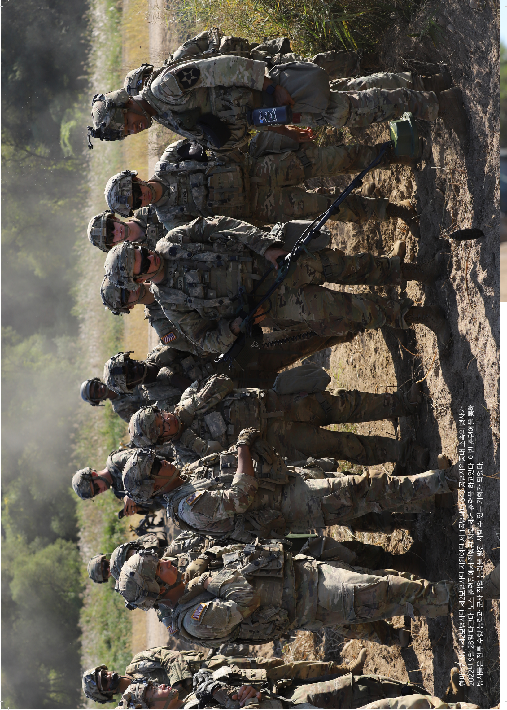
한미연합사단/제2보병사단 제2보병사단 지원여단 제11공병대대 643 공병지원중대 소속의 병사가 2022년 9월 28일 다그마-노스 훈련장에서 진행한 지뢰 제거 훈련을 하고있다. 이번 훈련을 통해 병사들은 전투 수행 능력과 군사 작업 능력을 발전시킬 수 있는 기회가 되었다.